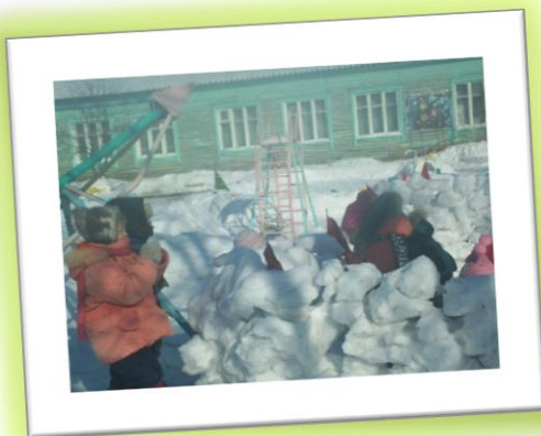
Взятие снежной крепости