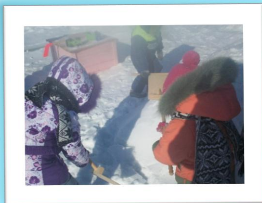
Зима для сильных и умелых